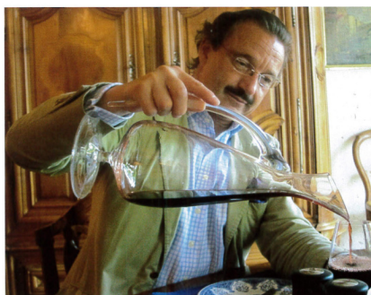
Il Conte Stephan de Neipperg dello Château d'Aiguilhe

Corps moyen. Long en bouche avec finale de prune et boisé. Joli vin qui nécessiterait d'un peu plus de fraîcheur. Vin plaisant dans l'ensemble.